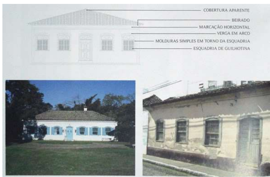
Figura 3: Amostra da arquitetura luso-brasileira. Disponível em: https://sites.google.com/site/pcpelotas/2--aspectos-da-historia-do-tracado-urbano-e-da-arquitetura-de-pelotas-1/tipologias-e-estilos-arquitetonicos-presentes-na-paisagem-urbana

*Cobertura aparente, com uso de beiral e inexistência de platibanda.