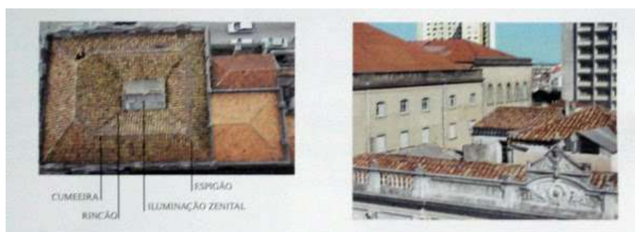
Figura 2: Aspectos de uma cobertura. Disponível em: https://sites.google.com/site/pcpelotas/2--aspectos-da-historia-do-tracado-urbano-e-da-arquitetura-de-pelotas-1/elementos-arquitetonicos-e-construtivos

Tipicamente, a cobertura é composta por telhado, estrutura o sustém, o forro na parte interna ao telhado, e as instalações pluviais que visam ao escoamento da água da chuva. Cada plano de um telhado é chamado de água .