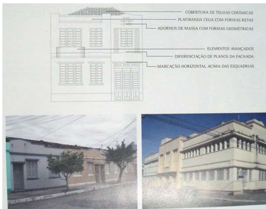
Figura 6: Amostra de arquitetura pré-moderna. Disponível em: https://sites.google.com/site/pccpelotas/2--aspectos-da-historia-do-tracado-urbano-e-da-arquitetura-de-pelotas-1/tipologias-e-estilos-arquitetonicos-presentes-na-paisagem-urbana

*Uso frequente do revestimento de cimento penteado.