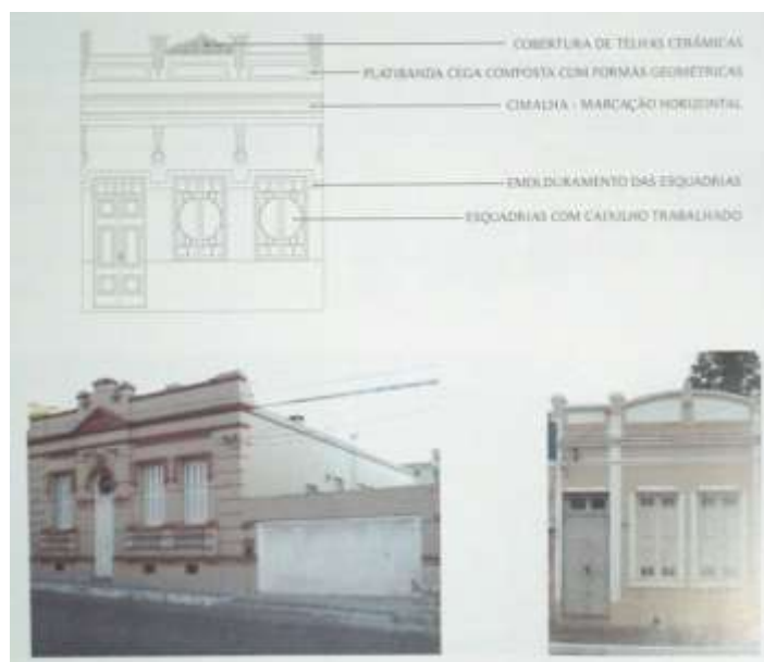
Figura 5: Amostra de arquitetura eclética de transição.

Análise pertinente: As fachadas frontais das duas edificações exibidas na fig. 6 parecem estar em ótimo estado de conservação, não obstante seja possível que haja microfissurações imperceptíveis nas imagens. Mais uma vez vale dizer que um estudo minucioso demandaria ensaios in situ , como a utilização de ultrassons para a aferição da homogeneidade do material, de dilatômetro para descoberta dos coeficientes de dilatação dos elementos estruturais e de outros ensaios dinâmicos (ARÊDE e COSTA).