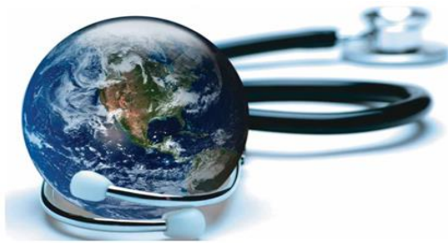
Figura 1 – Saúde e Ambiente