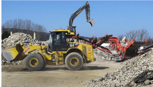
FIGURA 5 – Usina móvel