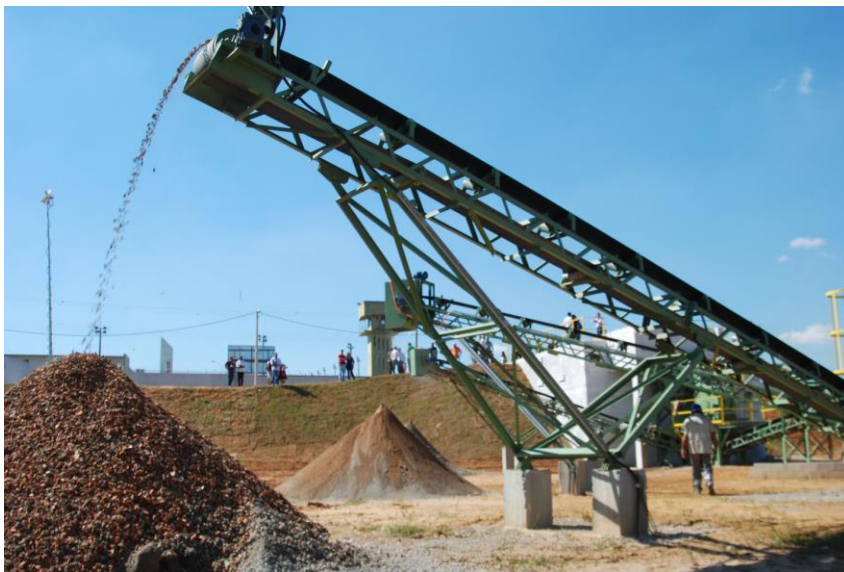
FIGURA 4 – Usina fixa