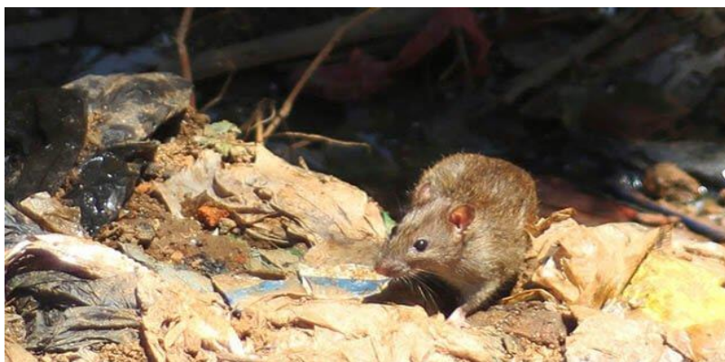
FIGURA 2 – Epidemias no entulho