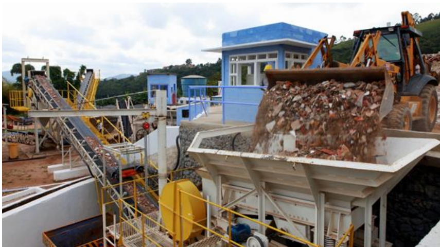
FIGURA 4 – Recicladora