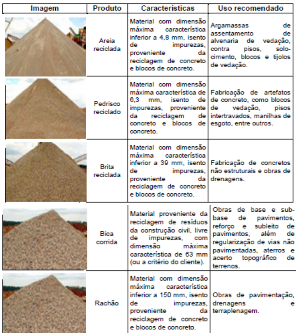
Figura 3: Uso recomendado para o agregado reciclado

Na FIG. 3 é possível verificar o uso recomendado para o agregado reciclado: