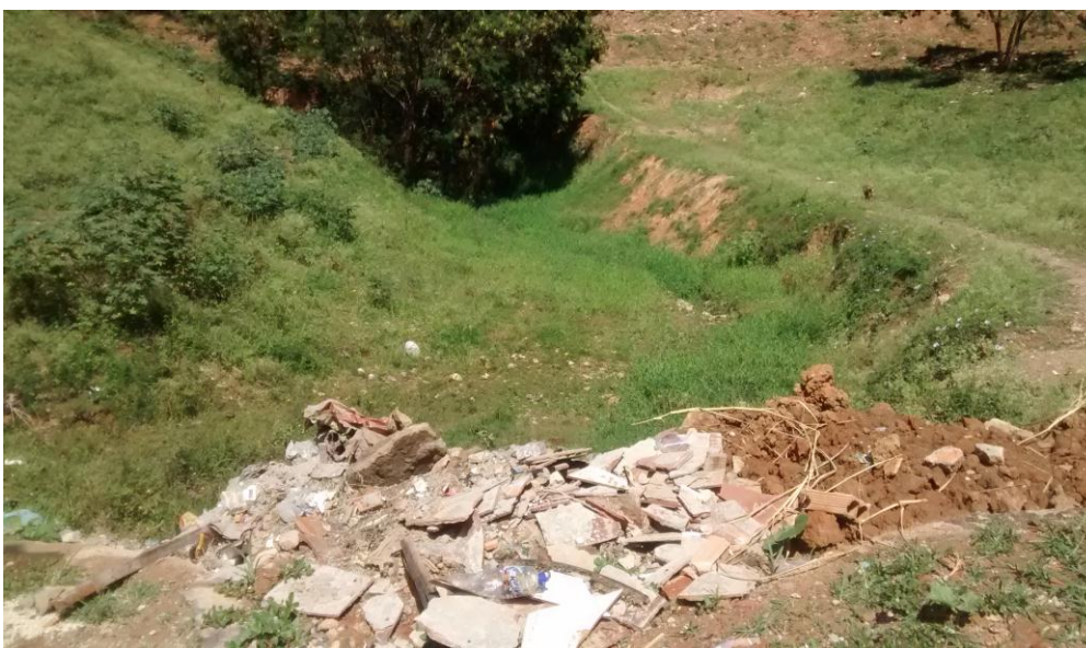
Figura 4 - Vala onde ocorre o depósito irregular do entulho

A área sugerida para a implementação da URPV foi estudada pela SLU, seguindo as normas de implantação anteriormente descritas. Esse local oferece as melhores condições para a implantação da Unidade de Recebimento de Pequenos Volumes devido aos aspectos geográficos e também está localizado próximo aos locais onde há maior incidência de deposição irregular, conforme mostra as Figuras 4 e 5. A área definida foi de 600m 2 , sendo a dimensão do local 20x30m.