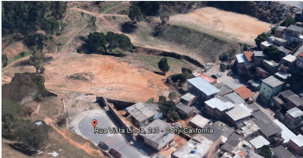
Figura 5 - Local sugerido para a implantação da URPV.

Foi realizada visita técnica na URPV Pindorama, localizada na Av. Amintas Jacques de Moraes, e observado como é feito o controle de depósito de resíduos, conforme mostra a Figura 6. Visitamos também a Estação de Reciclagem de Entulho localizada na Pampulha e conhecemos as etapas realizadas com os resíduos do local, Figura 7, e os produtos finais fabricados, Figura 8.