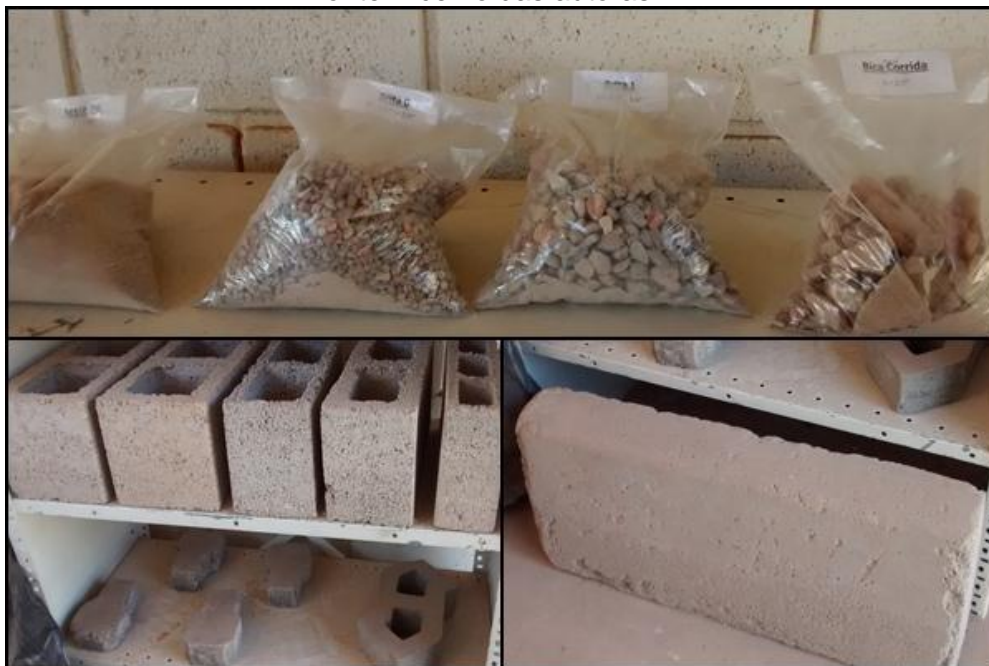
Figura 8 - Produto Final da Usina de Reciclagem

Após conhecer o local e analisar a planta padrão das URPVs foi possível estimar o custo global da obra proposta para o Bairro Califórnia, os resultados estão representados na Tabela 1.