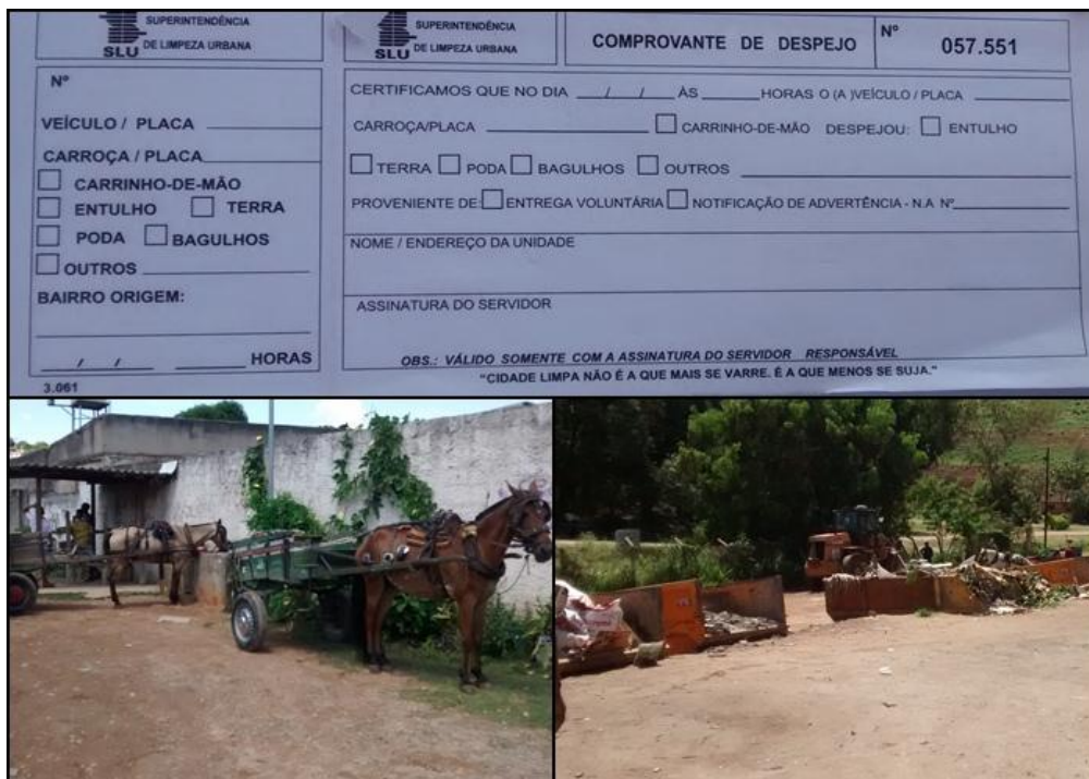
Figura 6- Controle e etapas do recebimento de resíduos na URPV.

Foi realizada visita técnica na URPV Pindorama, localizada na Av. Amintas Jacques de Moraes, e observado como é feito o controle de depósito de resíduos, conforme mostra a Figura 6. Visitamos também a Estação de Reciclagem de Entulho localizada na Pampulha e conhecemos as etapas realizadas com os resíduos do local, Figura 7, e os produtos finais fabricados, Figura 8.