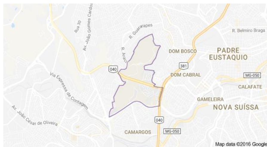
Figura 2- Localização do Bairro Califórnia

Entende-se como Bairro Califórnia a região envolvida pelos bairros Califórnia Velho e o Califórnia Novo, o Conjunto Califórnia I, o Califórnia II e a Vila Califórnia. As áreas à esquerda e direita da BR-040 Km 533, sentido Belo Horizonte - Brasília. O Bairro Califórnia ainda é limitado pelo Anel Rodoviário ao leste, a Avenida Presidente Juscelino Kubitschek (antiga Via Expressa) ao sul, o município de Contagem a sudoeste e com os bairros Filadélfia e Pindorama também a oeste, o Bairro Glória ao norte e os bairros Álvaro Camargos e Dom Bosco ao nordeste conforme apresenta o mapa da Figura 2 ( SOUZA, 2009 ).