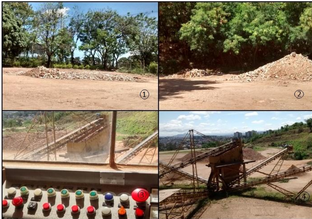
Figura 7- Etapas realizadas com os entulhos na Usina de Reciclagem