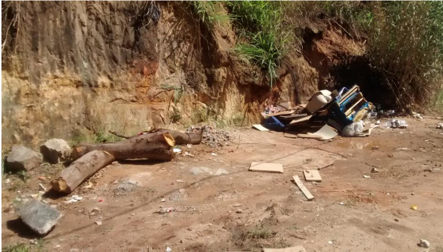
Figura 3 - Deposição de Lixo próximo a via pública no Bairro Califórnia

Essa deposição irregular pode ser debitada a insuficiência de locais apropriados para a deposição dos lixos. A URPV mais próxima do Bairro Califórnia está localizada a aproximadamente cinco quilômetros do local onde será proposto a implantação. A coleta de resíduos é realizada no bairro três vezes por semana pela prefeitura, porém ainda assim existe muita quantidade de resíduos acumulados nas ruas.