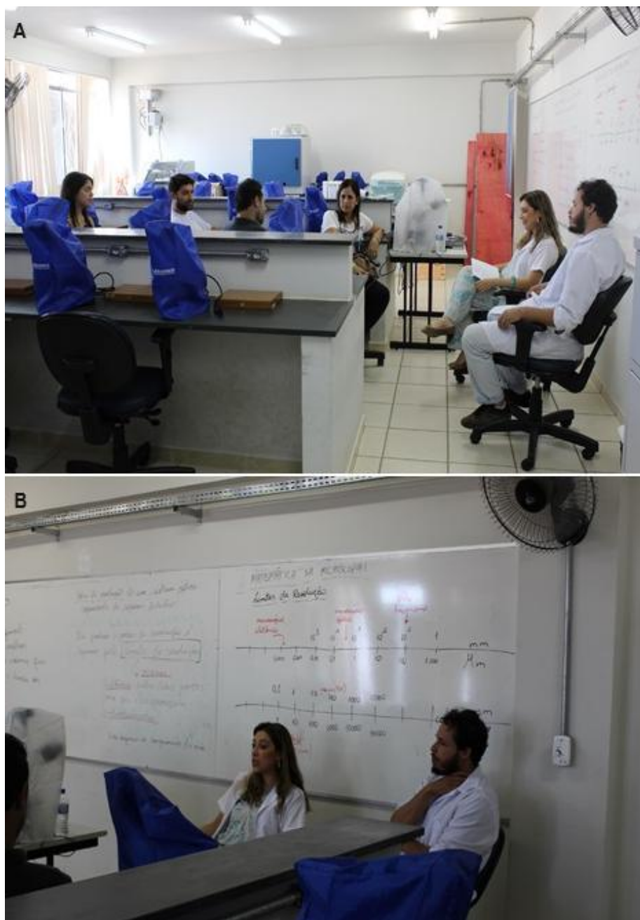
Figura 1: Oficina “A Matemática na Microscopia”. A) Roda de conversa e debate sobre conceitos de microscopia e implicações da matemática em estudos microscópicos. B) No quadro branco observa-se o trabalho com escalas matemáticas para compreensão dos limites de resolução do olho humano e dos microscópios. (Fonte: elaborada pelos próprios autores, 2017).

No segundo momento ocorreu a atividade prática de visualização de células da mucosa oral e o reconhecimento das partes constitutivas dessas células através da utilização do microscópio de luz. Com o auxílio dos tutores da oficina, os professores da educação básica executaram todos os passos de aula prática. Procederam a coleta do material com a raspagem da mucosa bucal com o auxílio