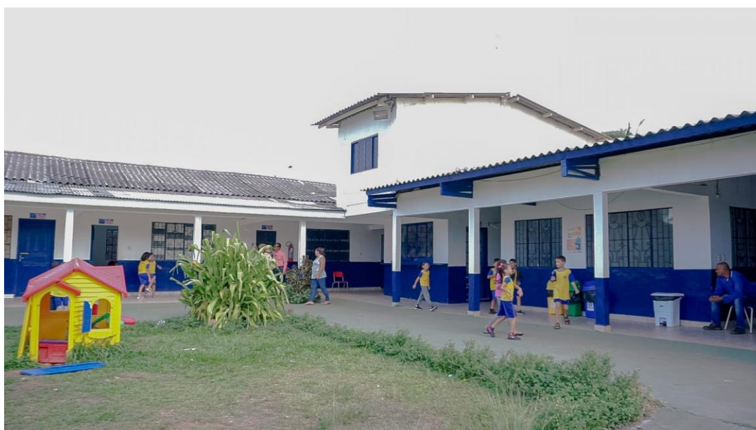
Figura 3 Área interna da EMEIEF Bilíngue Porto Velho-RO