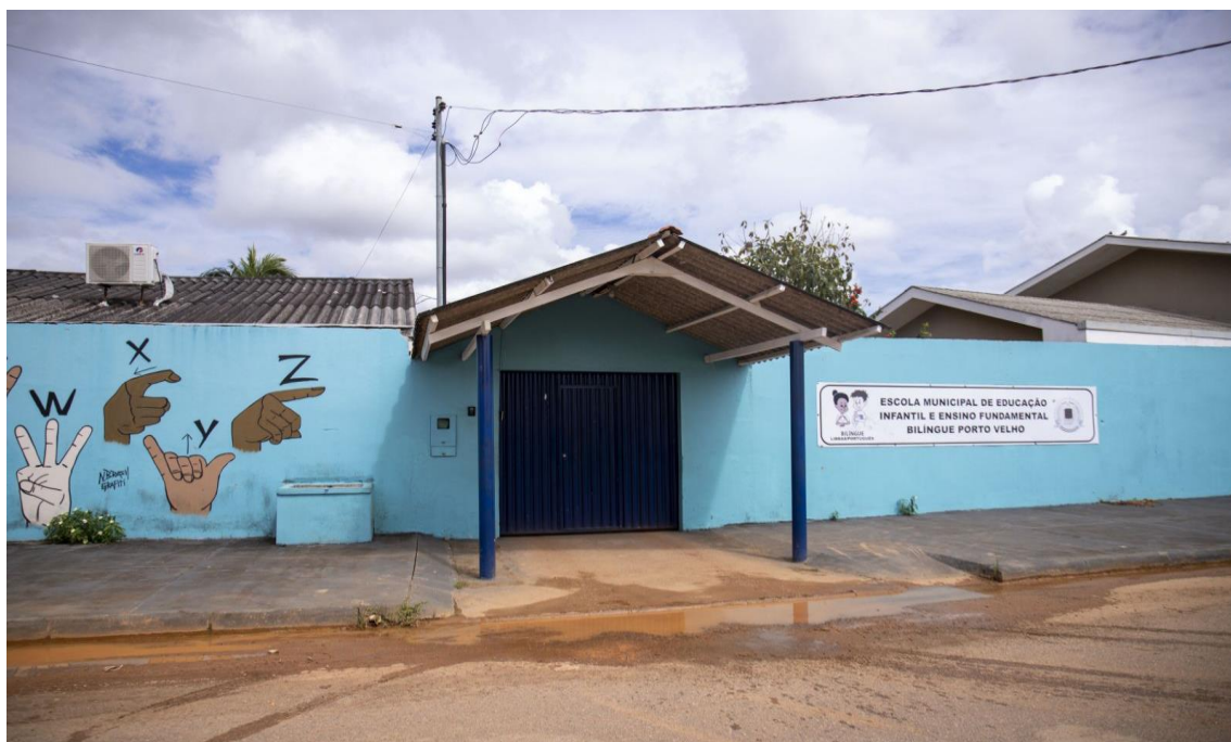
Figura 1 - EMEIEF Bilíngue Porto Velho-RO