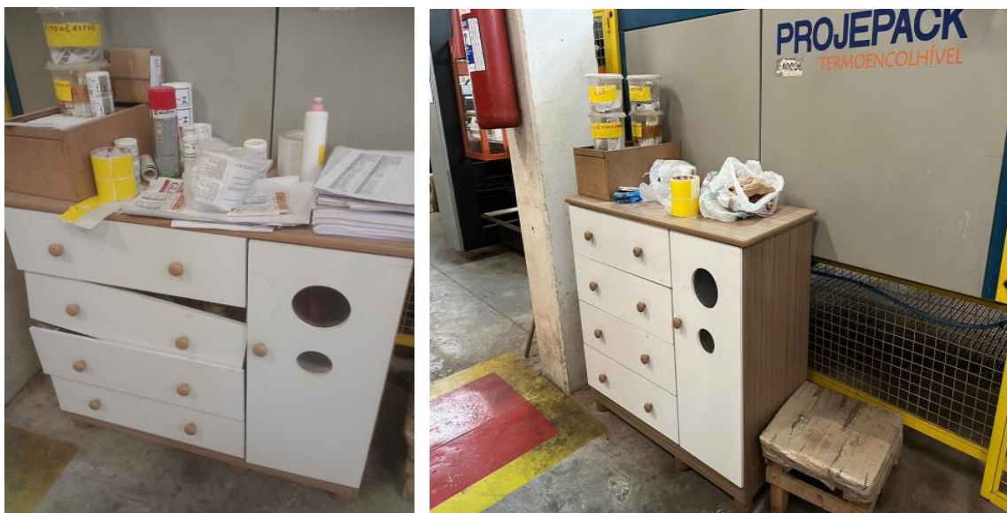
Figuras 2 – Unidade B antes e depois da implementação do 5S.

Essa visão positiva está alinhada com as conclusões de autores como Baptista (2020), que destacam os impactos positivos do 5S na organização e eficiência operacional das empresas. Tal entendimento foi visto ao longo dos departamentos, conforme percebido nas Figuras 2, da Unidade B, do antes e depois do 5S.