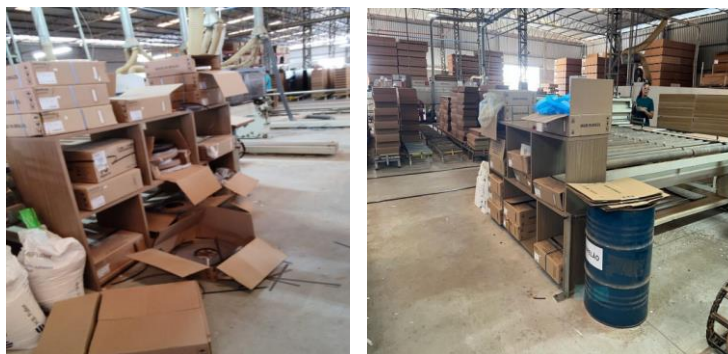
Figuras 5 – Unidade A antes e depois da implementação do 5S.

Além disso, os entrevistados expressaram otimismo em relação aos possíveis impactos positivos do uso da metodologia 5S pode trazer para a empresa Móveis Peroba. Muitos destacaram a expectativa de uma melhoria significativa na organização do ambiente de trabalho, na eficiência dos processos e na qualidade dos produtos fabricados como foi percebido na Unidade A, mostrado nas Figuras 5.