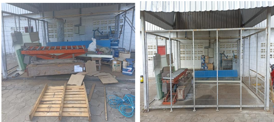
Figuras 4 – Triagem - Manutenção antes e depois da implementação do 5S.

Ademais, alguns entrevistados expressaram preocupações específicas sobre o 5S, como a possibilidade de resistência por parte de colegas de trabalho, principalmente no que diz respeito os profissionais da manutenção, mas que não foi obstáculo segundo mostrado nas Figuras 4. Essa preocupação reflete a necessidade de uma abordagem cuidadosa na comunicação e no engajamento dos colaboradores durante o processo de implementação, conforme discutido por autores como Manuel (2020).