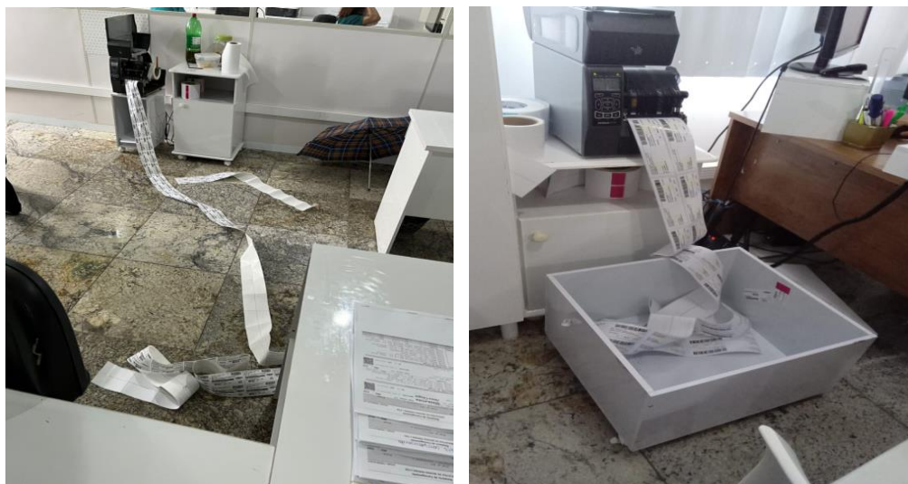
Figuras 3 – ADM – Comercial antes e depois da implementação do 5S.

O que foi demonstrado com as Figuras anteriores, que todos os departamentos estavam envolvidos com proposta do 5S, alcançando o setor administrativo, conforme mostrado nas Figuras 3.